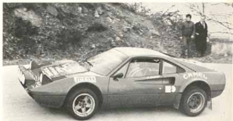
Una delle prime immagini della Ferrari 308 GTB in azione. La vettura non è ancora in versione definitiva. I cerchi sono ancora quelli Stratos.