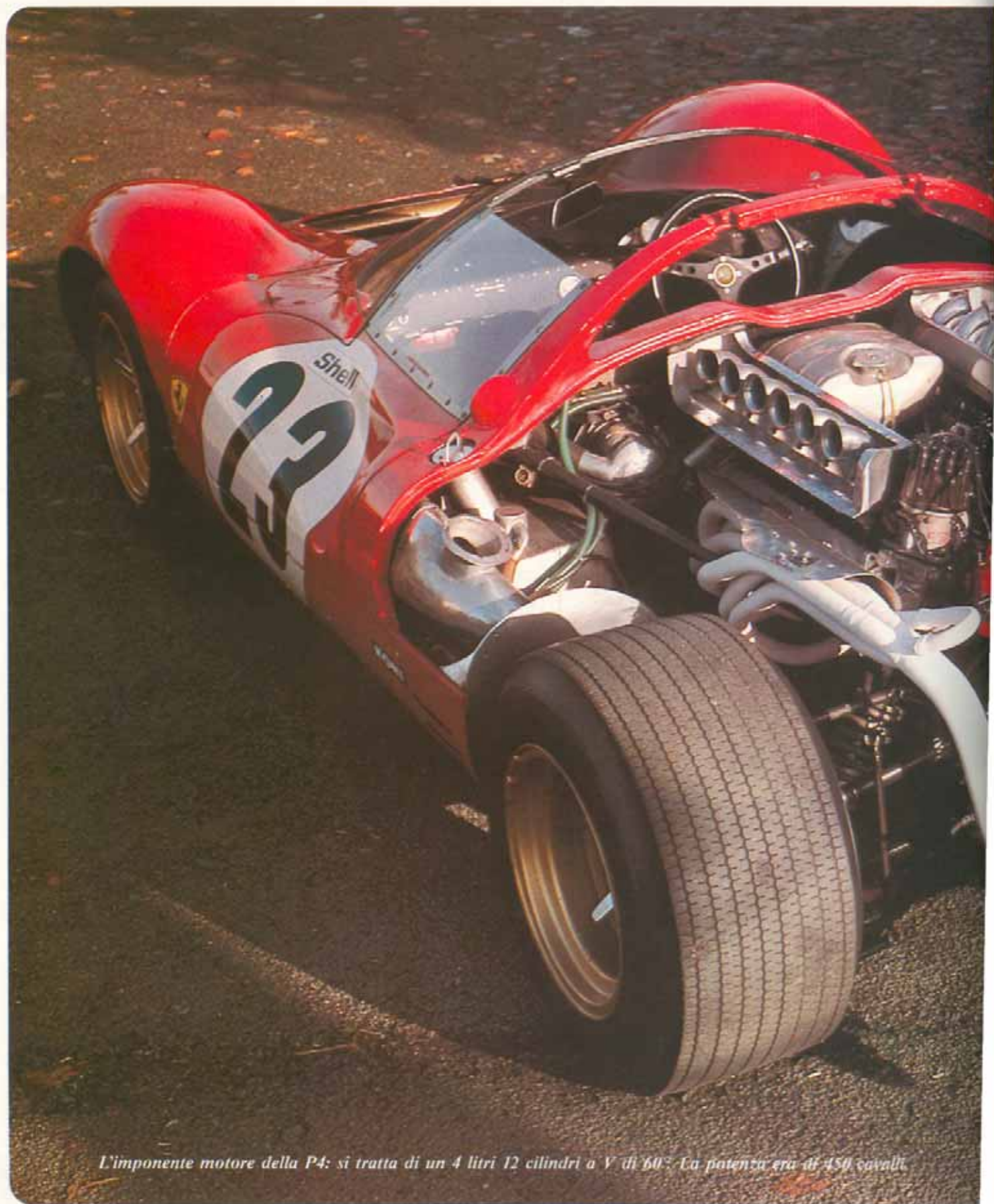
L'imponente motore della P4: si tratta di un 4 litri 12 cilindri a V di 60°. La potenza era di 450 cavalli.