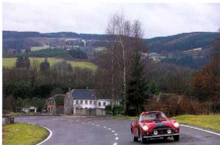
0879GT est la quinzième des seize berlinettes version 1958 que l'on reconnaît aux trois ouïes sur le panneau de custode. La découpe de peinture était une originalité du carrossier Scaglietti à cette époque.

A ussitôt après la catastrophe du Mans, en 1955, Ferrari, présentant des temps plus difficiles pour les prototypes « sport », a lancé les berlinettes 250 GT, une lignée dont le suffixe (GT pour Grand Tourisme) allait insuffler un nouvel élan au sport automobile. Rares sont, en effet, les voitures qui personnifient aussi bien le Grand Tourisme de compétition, tel qu'il fut pratiqué par de nombreux pilotes aux frontières de l'amateurisme et du professionnalisme au cours de la seconde moitié des années 50. Le surnom officieux de « Tour de France », que l'on prit l'habitude d'utiliser pour cette génération de berlinettes Ferrari 250 GT (avant l'apparition du modèle à empattement court en 1959, qui sera suivi de la GTO en 1962) évoque parfaitement cette époque, tout comme il illustre la domination que les GT de Maranello exercèrent dans ce type d'épreuves qui ne faisait pas de différence essentielle entre la route et le circuit. Le Tour de France représentait alors un mélange parfait des deux genres. Mais, même lorsqu'elle y côtoyait les prototypes de sport les plus rapides, la berlinette 250 GT dite TDF s'est aussi brillamment comportée dans les compétitions les plus fameuses, qu'il s'agisse d'épreuves de vitesse exclusivement routières, comme les dernières éditions des Mille Miglia, ou sur circuit, comme aux 24 Heures du Mans.