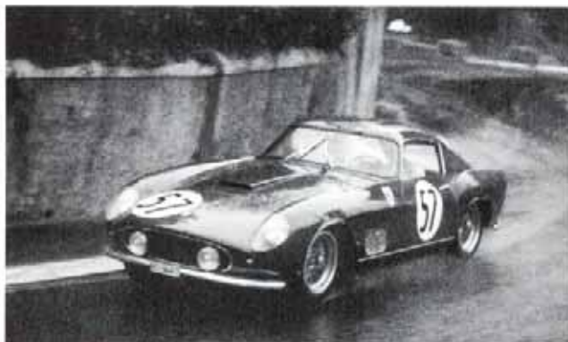
Seidel et 0879 toute neuve vers un premier succès, à Pau.