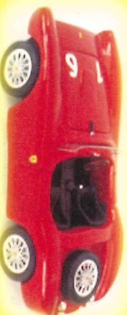
-RM020- Ferrari 212 Export Fontana GP Siracusa 1952 Siglinoffi