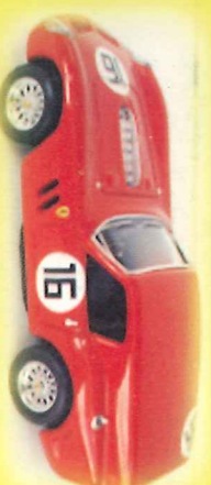
-RM027- Ferrari 250 GT Breadvan 24 ore di Le Mans