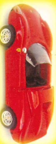
-RM017- Ferrari 330 P2