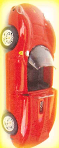
-RM016- Ferrari 330 S