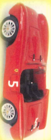
-RM021- Ferrari 375 MM Kimb. Num. 5 1954