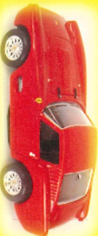
-RM011- Ferrari 250 GT