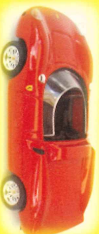
-RM015- Ferrari 250 P