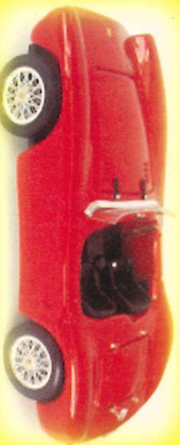
-RM007- Ferrari 500 Mondial