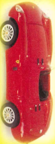
-RM008- Ferrari 750 Monza