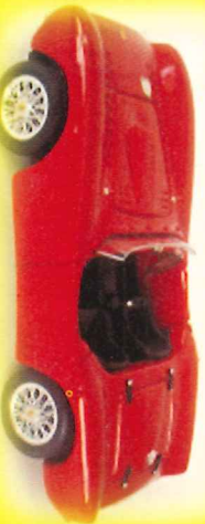
-RM006- Ferrari 375 MM