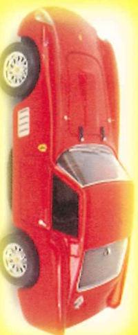
-RM013- Ferrari 250 TDF