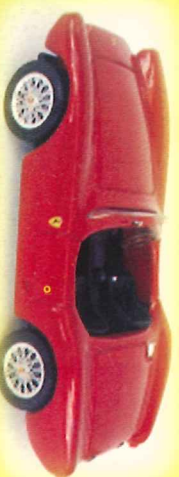
-RM002- Ferrari 225/250 S V.