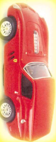
-RM014- Ferrari 250 GT Brad.