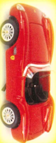
-RM012- Ferrari 500 TRC