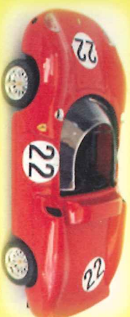
-RM028- Ferrari 250 P Le Mans 1963 Perker, Maglioli