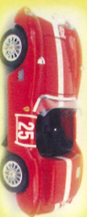
-RM026- Ferrari 500 TRC Nurburgring 1961 J. Siffert