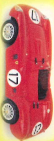
-RM023- Ferrari 860 Monza Sebring 1956 Fangio