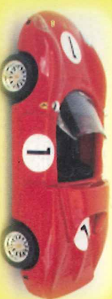
-RM029- Ferrari 330 P2 Nurburgring 1965 Surtrees Scarfiotti