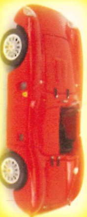
-RM010- Ferrari 860 Monza