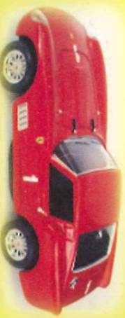
-RM025- Ferrari 250 TDF Mille Miglia 1958 L Tararazzo