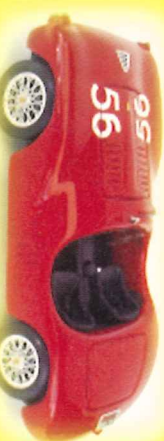
-RM019- Ferrari 125 S GP Roma 1947 Cortese