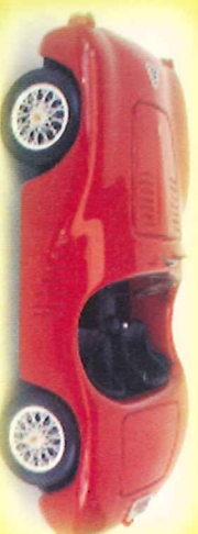
-RM001- Ferrari 125 S

Via Matilde di Canossa, 75 41027, Pievepelago (MO) Tel/Fax 053672184 E-mail info@rossomodel.com