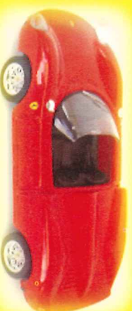
-RM018- Ferrari 330 P2