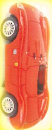
-RM009- Ferrari 500 TR