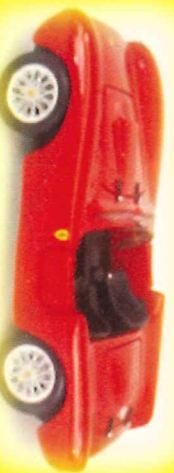
-RM005- Ferrari 375 MM Kimb.