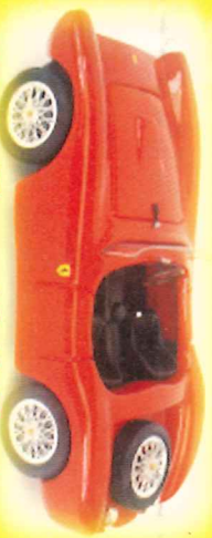
-RM003- Ferrari 340 Fontana