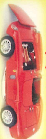
-RM030- Ferrari 750 Monza v. prova