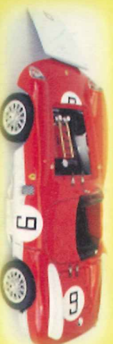
-RM031- Ferrari 750 Monza GP Porto 1956 Borges, Barretto